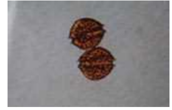
貝毒原因プランクトンの一種 アレキサンドリウム タマレンセ Alexandrium tamarense (大きさ1mmの1/30)

二枚貝は海水中のプランクトンなどを餌としています。一部の毒をもつプランクトンを摂取することによって、貝自体が毒素を中腸線（肝すい臓）に蓄積することにより起こるとされています。よって、プランクトンがいなくなれば、毒は貝から排泄されます。