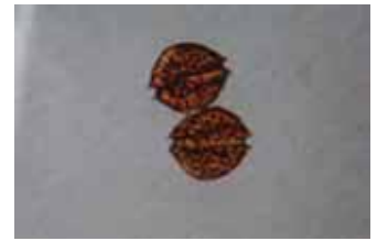
貝毒原因プランクトンの一種 アレキサンドリウム タマランセ Alexandrium tamarense (大きさ1mmの1/30)

貝毒量が一定期間連続して規制値未満であった場合、出荷自主規制処置を解除し、注意体制をとります。