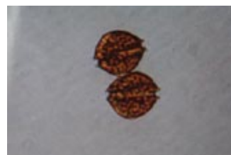
貝毒原因プランクトンの一種 アレキサンドリウム タマランセ Alexandrium tamarense (大きさ1mmの1/30)

貝毒量が一定期間連続して規制値未満であった場合、出荷自主規制処置を解除し、注意体制をとります。