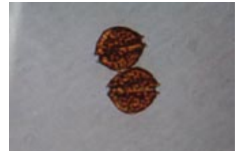
貝毒原因プランクトンの一種 アレキサンドリウム タマランセ Alexandrium tamarense (大きさ1mmの1/30)

貝毒量が一定期間連続して規制値未満であった場合、出荷自主規制処置を解除し、注意体制をとります。