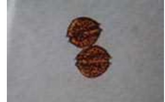
貝毒原因プランクトンの一種 アレキサンドリウム タマレンセ Alexandrium tamarense (大きさ1mmの1/30)

貝毒量が一定期間連続して規制値未満であった場合、出荷自主規制処置を解除し、注意体制をとります。