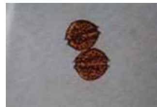
貝毒原因プランクトンの一種

貝毒量が一定期間連続して規制値未満であった場合、出荷自主規制処置を解除し、注意体制をとります。