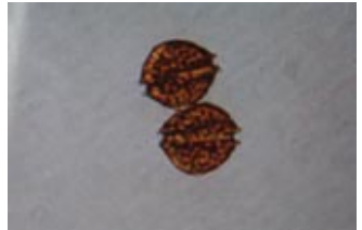
貝毒原因プランクトンの一種 アレキサンドリウム タマレンセ Alexandrium tamarense (大きさ1mmの1/30)

二枚貝は海水中のプランクトンなどを餌としています。一部の毒をもつプランクトンを摂取することによって、貝自体が毒素を中腸線（肝すい臓）に蓄積することにより起こるとされています。よって、プランクトンがいなくなれば、毒は貝から排泄されます。