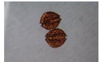
貝毒原因プランクトンの一種 アレキサンドリウム タマレンセ Alexandrium tamarense (大きさ1mmの1/30)

貝毒量が一定期間連続して規制値未満であった場合、出荷自主規制処置を解除し、注意体制をとります。