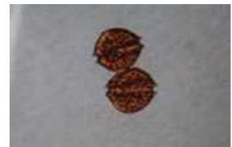
貝毒原因プランクトンの一種 アレキサンドリウム タマレンセ Alexandrium tamarense (大きさ1mmの1/30)

貝毒量が一定期間連続して規制値未満であった場合、出荷自主規制処置を解除し、注意体制をとります。