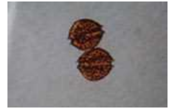
貝毒原因プランクトンの一種 アレキサンドリウム タマレンセ Alexandrium tamarense (大きさ1mmの1/30)

二枚貝は海水中のプランクトンなどを餌としています。一部の毒をもつプランクトンを摂取することによって、貝自体が毒素を中腸線（肝すい臓）に蓄積することにより起こるとされています。よって、プランクトンがいなくなれば、毒は貝から排泄されます。