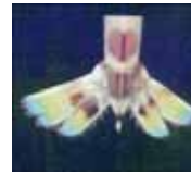
切除した側の尾肢がいびつな形に再生する