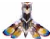
切除した側の尾肢の暗赤色色素の帯が十分に再生しない