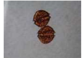
貝毒原因プランクトンの一種 アレキサンドリウム タマレンセ (旧) Alexandrium tamarense (大きさ 1mmの 1/30)

※1 貝毒原因プランクトンの分類については、2020年4月より、(国研)水産研究・教育機構瀬戸内海区水産研究所が提案した呼称に従って表記しています。新称のうち、前者は形態により判断した場合の呼称、後者は分子生物学的手法により判定した場合の呼称です。詳しくは、同研究所の関係資料ウェブサイトをご覧ください。