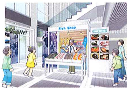
(1-4. 私たちと兵庫県の海とのつながり)