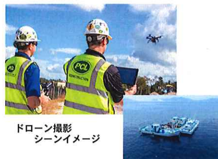
ドローン撮影 シーンイメージ