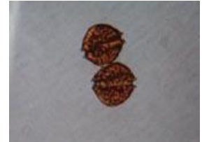
貝毒原因プランクトンの一種 アレキサンドリウム タマレンセ (旧) Alexandrium tamarense (大きさ 1mmの 1/30)

※1 貝毒原因プランクトンの分類については、2020年4月より、(国研)水産研究・教育機構瀬戸内海区水産研究所が提案した呼称に従って表記しています。新称のうち、前者は形態により判断した場合の呼称、後者は分子生物学的手法により判定した場合の呼称です。詳しくは、同研究所の関係資料ウェブサイトをご覧ください。