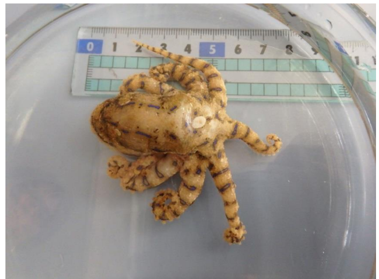
ヒョウモンダコ（H29.12.23採捕）

§ お問い合わせ先 § 兵庫県立農林水産技術総合センター水産技術センター（担当：水産環境部 中桐） Tel：078-941-8601 Fax：078-941-8604 Homepage：http://www.hyogo-suigi.jp/