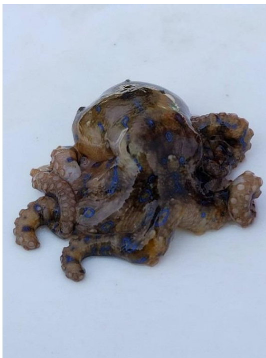
ヒョウモンダコ（H30.4.4採捕）