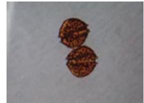
貝毒原因プランクトンの一種 アレキサンドリウム タマレンセ (旧) Alexandrium tamarense (大きさ 1mmの 1/30)

※1 貝毒原因プランクトンの分類については、2020年4月より、(国研)水産研究・教育機構瀬戸内海区水産研究所が提案した呼称に従って表記しています。新称のうち、前者は形態により判断した場合の呼称、後者は分子生物学的手法により判定した場合の呼称です。詳しくは、同研究所の関係資料ウェブサイトをご覧ください。