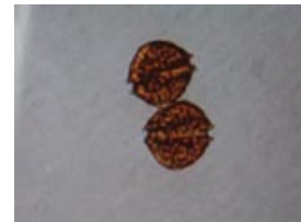
貝毒原因プランクトンの一種 アレキサンドリウム タマレンセ (旧) Alexandrium tamarense (大きさ 1 mm の 1/30)

※1 貝毒原因プランクトンの分類については、2020年4月より、(国研)水産研究・教育機構瀬戸内海区水産研究所が提案した呼称に従って表記しています。新称のうち、前者は形態により判断した場合の呼称、後者は分子生物学的手法により判定した場合の呼称です。詳しくは、同研究所の関係資料ウェブサイトをご覧ください。